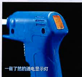
一目了然的通电显示灯